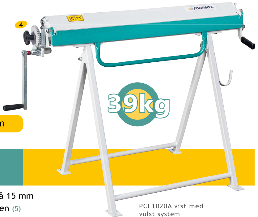
PCL1020A vist med vulst system